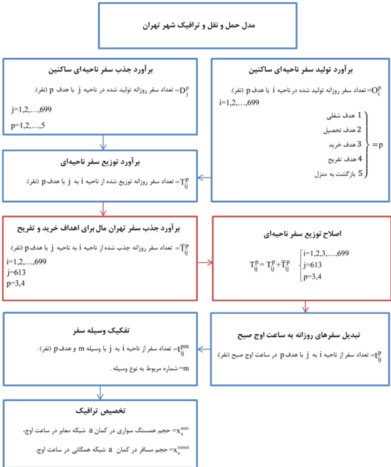
شکل ۲. نحوه برآورد جذب سفر فرامنطقه‌ای مجتمع تهران مال (مستطیل‌های قرمز) در مدل ۴-مرحله‌ای تهران