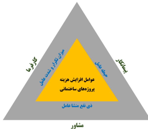
شکل ۱. مدل مفهومی سلسه مراتب پژوهش