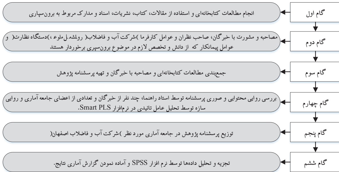
شکل ۱. روند انجام پژوهش