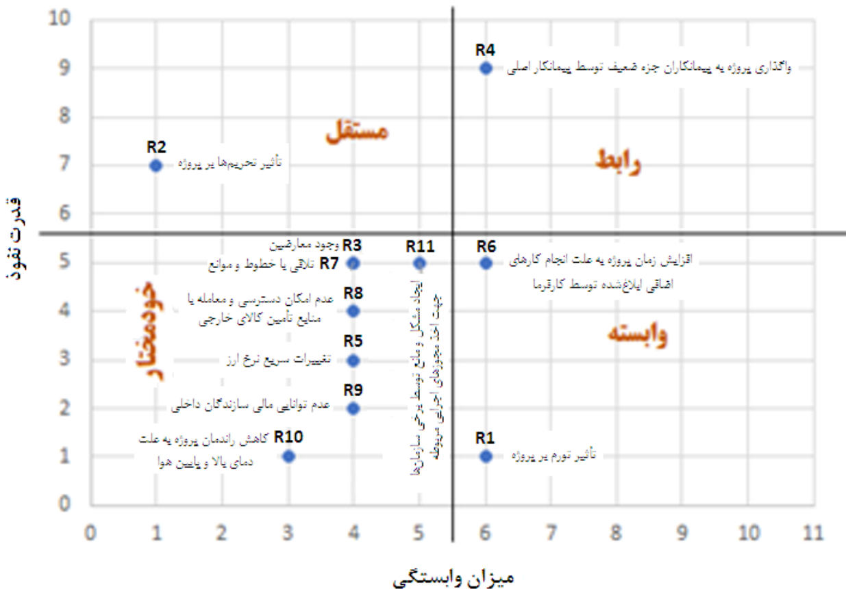
شکل ۲. ماتریس قدرت نفوذ- میزان وابستگی