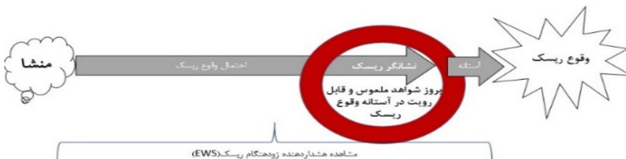
شکل ۲. جایگاه هشداردهنده زودهنگام و نشانگر ریسک نسبت به هم و ارتباط با ریسک و منشأ