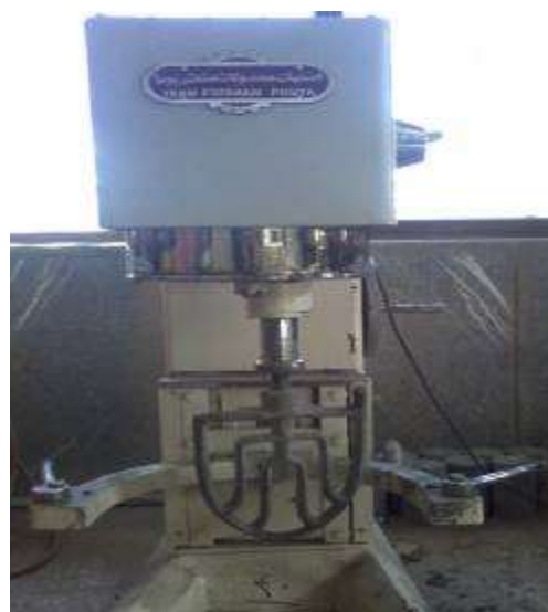
شکل ۳. مخلوط‌کن مورد استفاده در این تحقیق با حداکثر سرعت ۳۶۰ دور بر دقیقه.