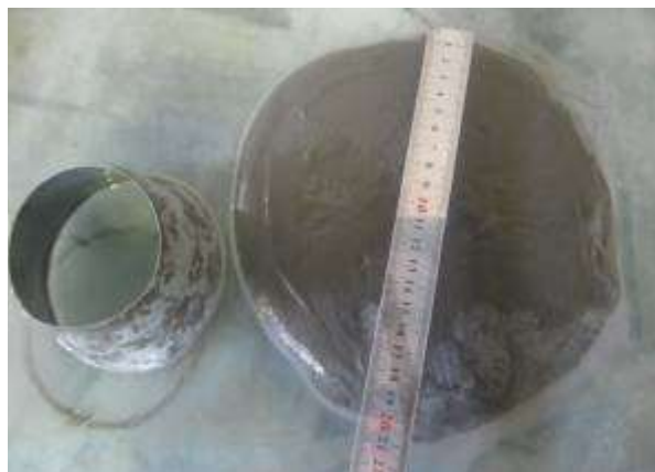
شکل ۲. نمونه‌ای از آزمایش جریان اسلامپ کوچک.

کارایی یک مشخصه‌ی مهم بتن RPC به‌شمار می‌رود. در بتن RPC به دلیل سرعت بالای از دست دادن کارایی، باید جریان اسلامپ مناسبی هنگام قالب‌گیری انتخاب شود. در این تحقیق برای مقایسه‌ی طرح‌های اختلاط، میزان فوق‌روان‌کننده‌ی کلیه‌ی طرح‌های اختلاط طوری تنظیم گردید که قطر پخش‌شدگی در آزمایش جریان اسلامپ کوچک برابر 10 \pm 200 میلی‌متر شود. ظرف آزمایش جریان اسلامپ، یک مخروط ناقص با قطر کوچک ۷۰ mm، قطر بزرگ ۱۰۰ mm و ارتفاع ۶۰ mm می‌باشد. نمونه‌ای از این آزمایش در شکل ۲ نشان داده شده است.