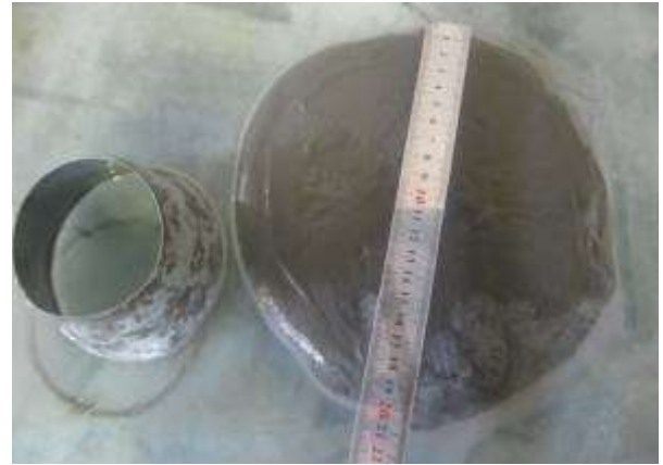
شکل ۲: نمونه‌ای از آزمایش جریان اسلامپ کوچک.

کارایی یک مشخصه‌ی مهم بتن RPC به‌شمار می‌رود. در بتن RPC به دلیل سرعت بالای از دست دادن کارایی، باید جریان اسلامپ مناسبی هنگام قالب‌گیری انتخاب شود. در این تحقیق برای مقایسه‌ی طرح‌های اختلاط، میزان فوق‌روان‌کننده‌ی کلیه‌ی طرح‌های اختلاط طوری تنظیم گردید که قطر پخش‌شدگی در آزمایش جریان اسلامپ کوچک برابر 10 \pm 200 میلی‌متر شود. ظرف آزمایش جریان اسلامپ یک مخروط ناقص با قطر کوچک ۷۰ mm، قطر بزرگ ۱۰۰ mm و ارتفاع ۶۰ mm می‌باشد. نمونه‌ای از این آزمایش در شکل ۲ نشان داده شده است.