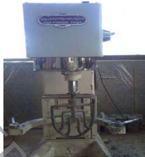
شکل ۳: مخلوط‌کن مورد استفاده در این تحقیق با حداکثر سرعت ۳۶۰ دور بر دقیقه.

نتایج تحقیقات هیرمات و پاراگال نشان داده است که مخلوط‌های بتنی که با مخلوط‌کن با سرعت کم ساخته می‌شوند، دارای ساختار متخلخل هستند و ناحیه‌ی انتقال بین خمیر سیمان و ریزدانه‌ها ضعیف می‌باشد [۳۴]. استفاده از مخلوط‌کن با سرعت دوران بالا در بتن RPC باعث بهبود کیفیت بتن ساخته شده می‌شود. این محققین بهترین سرعت مخلوط کردن مصالح را ۱۰۰ دور بر دقیقه و بهترین مدت زمان اختلاط را ۱۵ دقیقه اعلام نموده‌اند. در تحقیق حاضر، برای ساخت نمونه‌های بتنی از مخلوط‌کن ویژه‌ای که در شکل ۳ نشان داده شده است و دارای حداکثر سرعت دورانی ۳۶۰ دور بر دقیقه است، استفاده شده است.